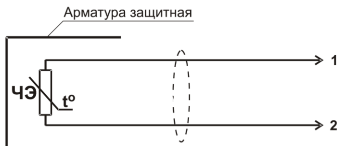
Рисунок 1 - Схема подключения

Схема подключения приведена на рисунке 1.